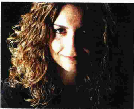
Ζωή Τσόκανου | καλλιτεχνική διευθύντρια της Κρατικής Ορχήστρας Θεσσαλονίκης

Χωρίς μόνιμη στέγη, με κορυφαίους σολίστ και εξωστρέφεια